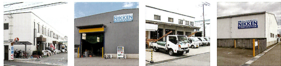
大阪本社 大阪西営業所 大阪北営業所 京都営業所

関西の4拠点から、 他社に負けない圧倒的な 在庫力と商品力でスピード納品いたします。 当日配送・緊急対応もお任せください。